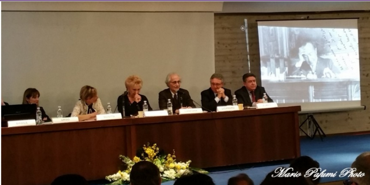
pubblicato il 17 aprile 2015 alle 15.58